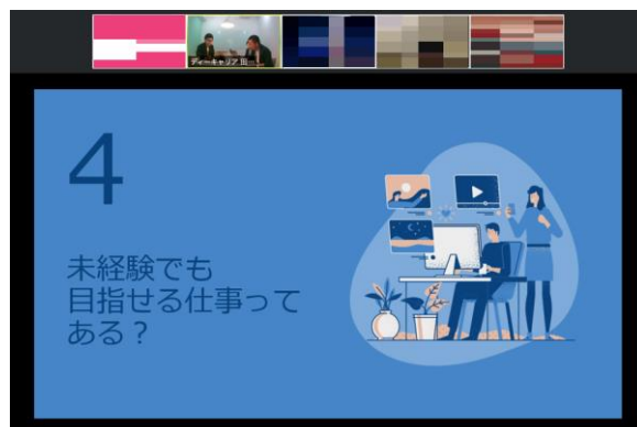
▲4月18日にZoomで講座を開催した際の様子